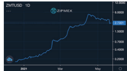
กราฟการเคลื่อนไหวของราคา ZMT

จากภาพแสดงถึงราคาของ ZMT ตั้งแต่ 18 ส.ค. 2020 - ปัจจุบัน (21 พ.ค. 2021)