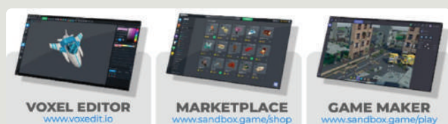
VOXEL EDITOR www.voxedit.io

ผลิตภัณฑ์ของ Sandbox Platform คือ VoxEdit, Marketplace, Game Maker และ Game Platform มีดังนี้