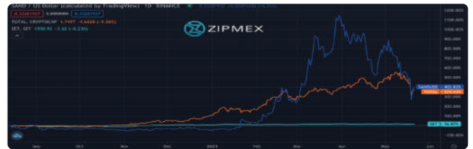
■ ราคา SAND ■ ราคา Total Market Cap ■ Set Index จากภาพแสดงถึงการเปลี่ยนแปลงของราคาในช่วงระยะเวลาตั้งแต่ปี 2020 - วันที่ 20 พ.ค. 2021